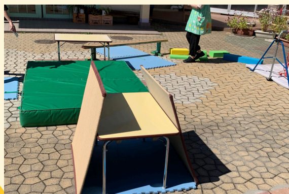
テーブルのトンネル