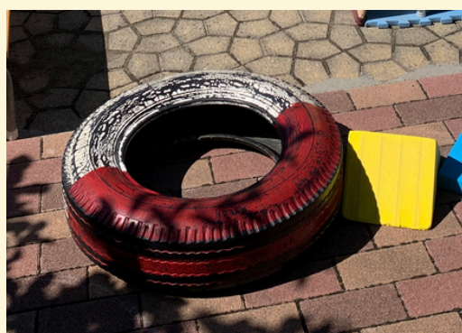
タイヤひっぱりのタイヤ