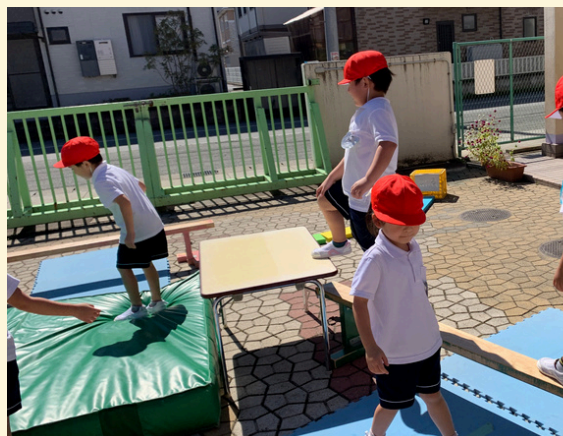
みんな大好きジャンプ台