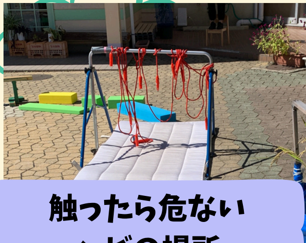
触ったら危ない ヘビの場所

また、迷路のメイン障害物になるもの（トンネルやジャンプ台など）を先に置いて1つのコースが作りやすいようにしてみました！ すると、またまたあっという間に道ができていく！