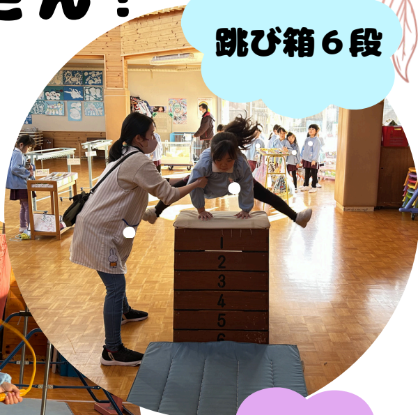
跳び箱 6 段