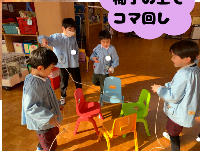
椅子の上で コマ回し