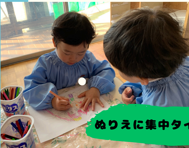
ぬりえに集中タイム