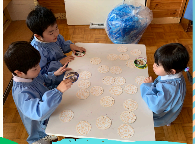
絵合わせカード！ さあ何枚見つけられるかな??