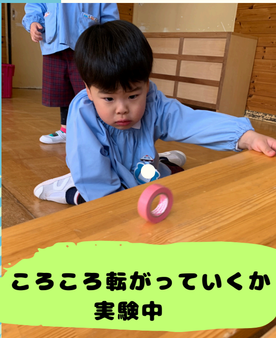
ころころ転がっていくか 実験中

朝の準備の仕方にもだいに慣れ、 身支度を終えた子からやりたい遊びを 見つけて遊び出す姿が見られている 子ども達。やりたいことや好きな遊びを 通して、友達や先生と楽しいね♡という 思いを一緒に感じていく時間を大切に していきたいと思っています。 また来週からの個人面談で一人一人の 様子をお家の方と共有できることを 楽しみにしています。