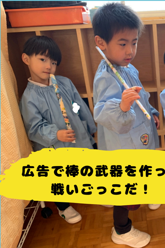
広告で棒の武器を作って 戦いごっこだ！